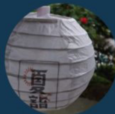
夏詣特別 ちょうちん配布