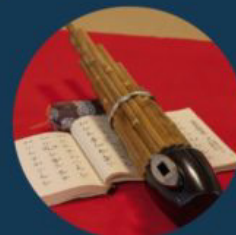
1日5日10日限定 雅楽演奏